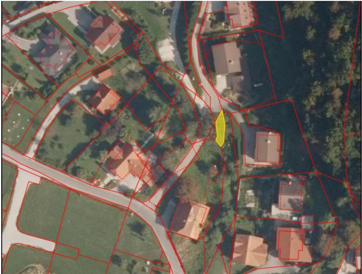
Grafični prikaz parcele: zemljišče, ki je predmet ukinitve družbene lastnine v splošni rabi

Zaradi učinkovitejšega gospodarjenja je v interesu občine, da uredi status zgoraj navedene parcele.